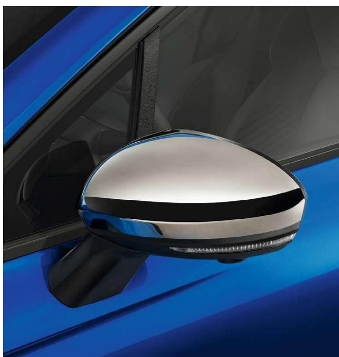
hromirana kućišta spoljnih retrovizora