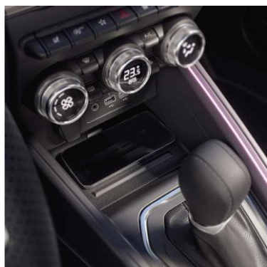
bežični punjač (1)

Dodatno zatamnite unutrašnjost svog vozila štitnicima za zadnja stakla i stakla na vratima prtljažnika.