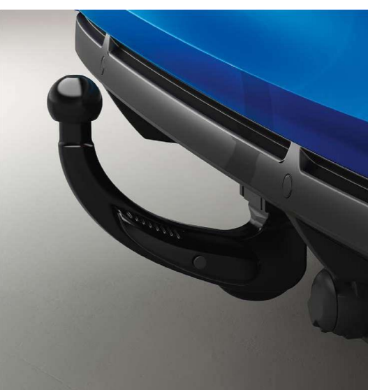
vučna kuka - odvojiva bez upotrebe ruku