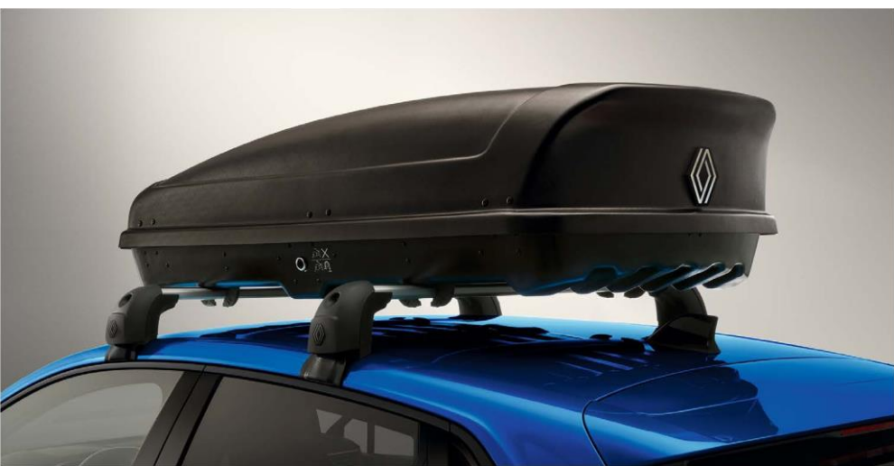
tvrdi krovni kofer, 380 l

Povećajte nosivost vozila pomoću krovnih kofera ili nosača za skije koji se jednostavno montiraju.