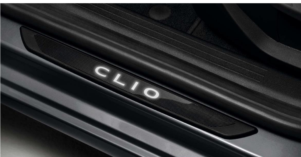
zaštita pragova vrata osvetljenim natpisom Clio(1)(2)

Odlučite se za zaštitu pragova vrata sa osvetljenim natpisom Clio jer ovaj dodatak pruža još luksuzniji osećaj i štiti pragove vrata.