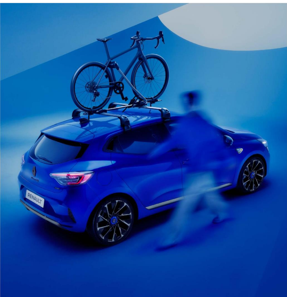
nosač za bicikle – aluminijski krovni nosači QuickFix

Brže pakovanje stvari vam daje više vremena za uživanje u omiljenim aktivnostima. Brzo i bez alata postavite krovne nosače zahvaljujući sistemu QuickFix.