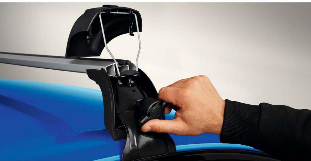
aluminijski krovni nosači QuickFix

Brže pakovanje stvari vam daje više vremena za uživanje u omiljenim aktivnostima. Brzo i bez alata postavite krovne nosače zahvaljujući sistemu QuickFix.