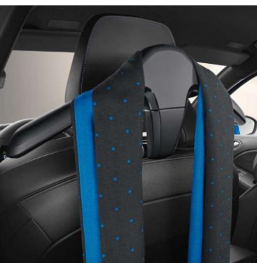
vešalica na višenamenskom sistemu

Uz dva saveta učinite lakšim svakodnevni život i putovanja: okačite odeću kako se ne bi izgužvala i koristite bežični punjač za jednostavno punjenje vašeg pametnog telefona u bilo kom trenutku postavljajući ga na postolje za punjenje.