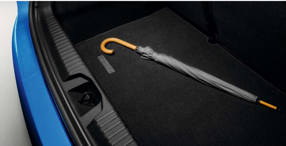
podna obloga prtljažnika

Visokokvalitetna podna obloga je veoma praktična, otporna i jednostavna za održavanje i kao takva potpuno štiti oblogu prtljažnog prostora.