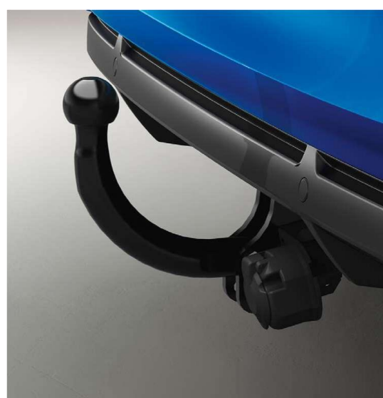
produžena vučna kuka