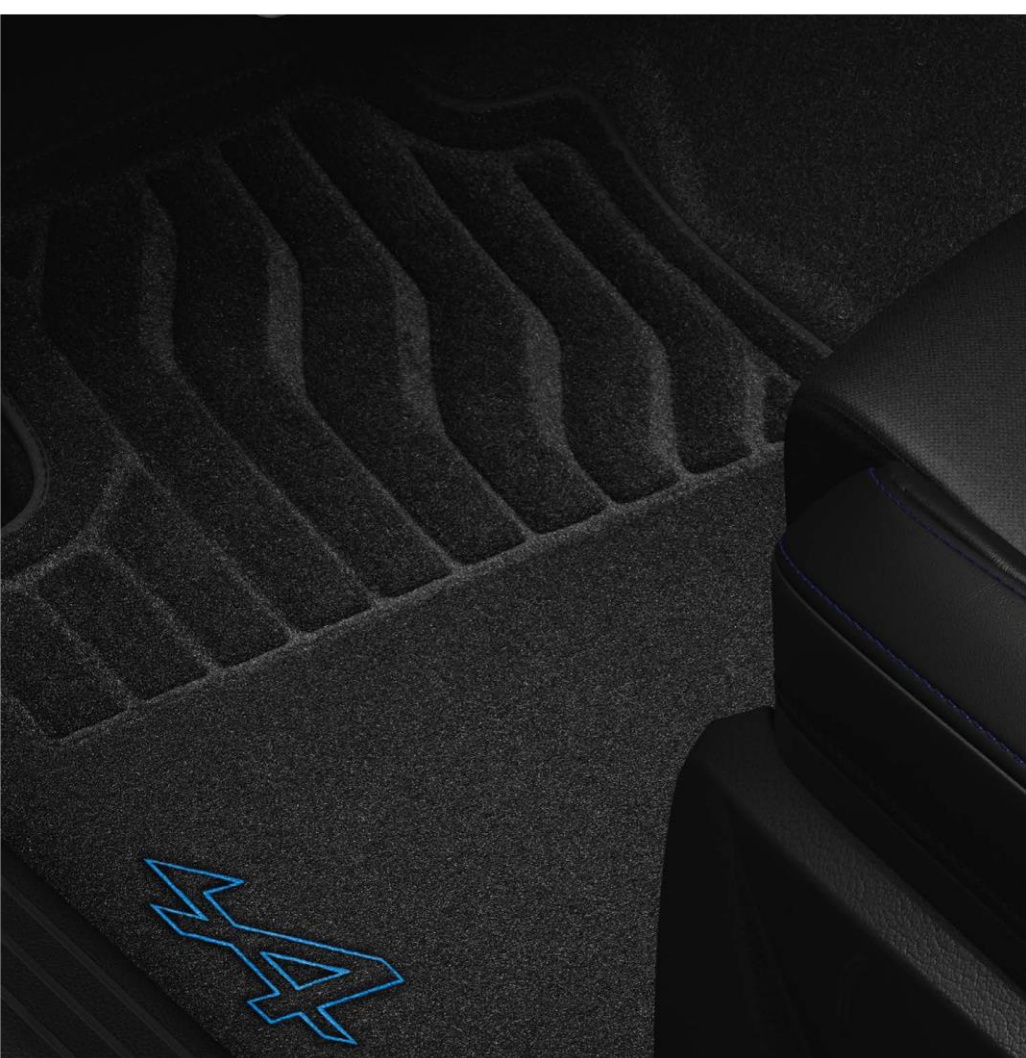
tekstilna patosnica Esprit Alpine

Tekstilnim patosnicama Esprit Alpine dobijate sportski izgled unutrašnjosti vašeg vozila.