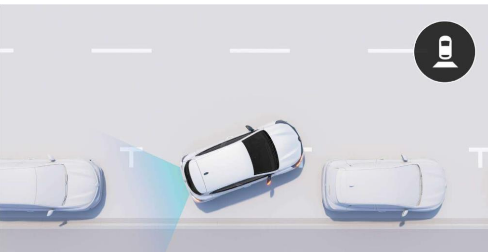
kamera za vožnju unazad (1) (uskoro)

Koristite kameru za vožnju unazad i olakšajte upravljanje.