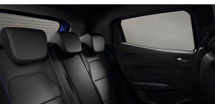
štitnici za sunce

Dodatno zatamnite unutrašnjost svog vozila štitnicima za zadnja stakla i stakla na vratima prtljažnika.