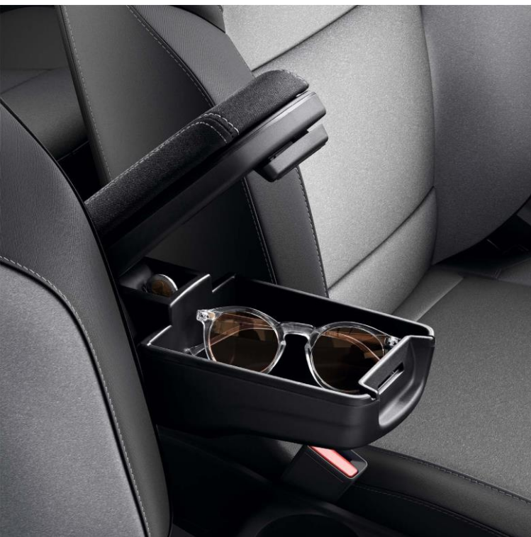
prednji naslon za ruke (1)

Elegantna i funkcionalna oprema iz naše ponude unutrašnje opreme osmišljena je sa ciljem da vaša putovanja učini još prijatnijima. Kao deo unutrašnje opreme tu je centralni naslon za ruke koji nudi veću udobnost i dodatni pretinac za odlaganje predmeta.