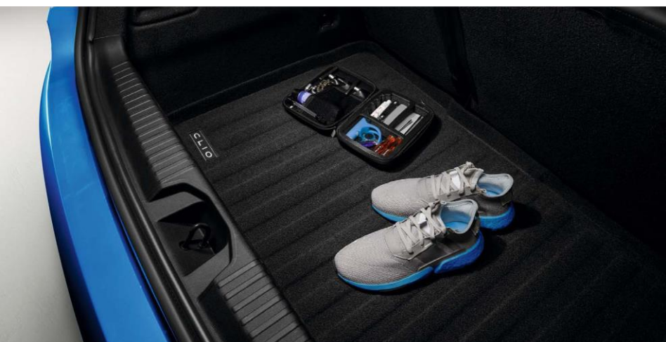
dvostrano korito za dno prtljažnika

Uz Renault Clio možete savladati sve prepreke u svakodnevnom životu upotrebom dvostranog korita sa podignutim ivicama za dno prtljažnika koje je voodootporno, a izrađeno je po meri vozila.