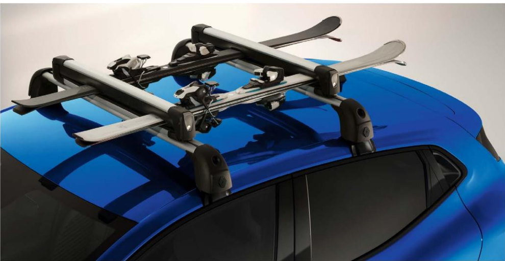
nosač za 4 para skija/2 snowboarda – slika je simbolična