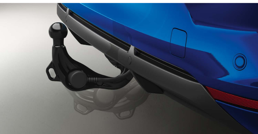
sklopiva polu-električna vučna kuka

Sklopiva i polu-električna vučna kuka, izvlači se za tren oka i potpuno je neprimetna nakon sklapanja.