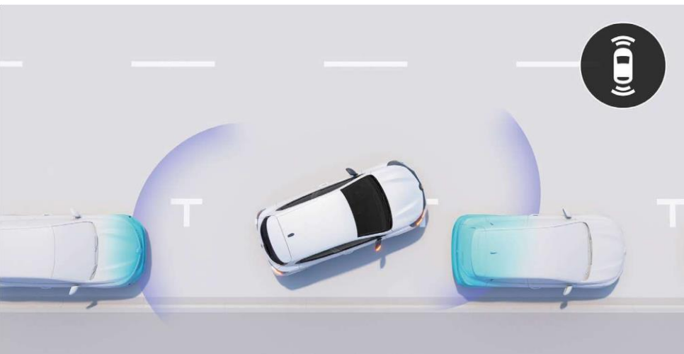
sistem prednjih i zadnjih parkirnih senzora (uskoro)

Neprocenjiva pomoć za bezbrižno upravljanje. Senzori detektuju moguće prepreke iza vozila. Zvučni signal upozorava na prepreku