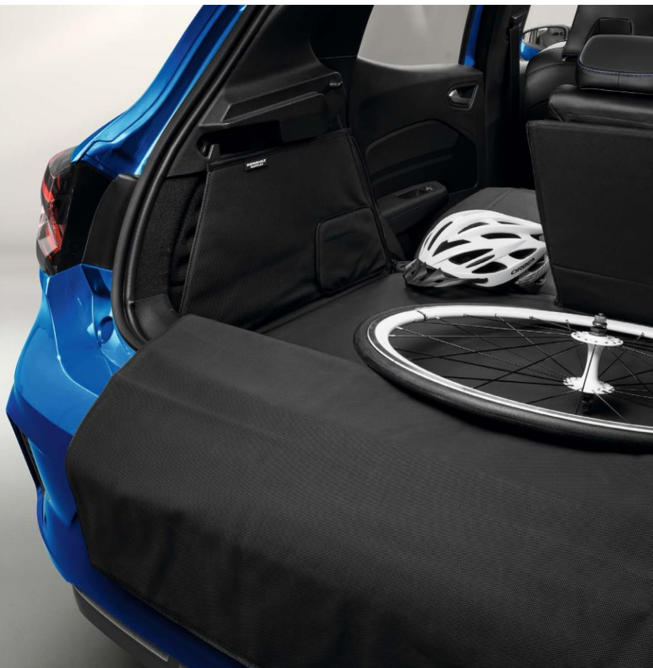
prilagodljiva zaštita prtljažnog prostora EasyFlex

Da vaše novo vozilo Renault Clio E-Tech full hybrid očuva sjajan izgled i prtljažni prostor omogućava EasyFlex zaštita kojom možete pokriti ceo prag i unutrašnjost prtljažnika. Zaštita je voodootporna i prilagodljiva što je čini savršenom za transport kabastog i zaprljanog prtljaga.